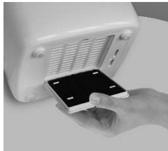
Рис. 9 Фильтр очистки воздуха Pre-filter

Воздух может содержать в себе различные примеси, которые могут при дыхании попадать в дыхательные пути человека или оседать в приборах. Фильтр очищает воздух от крупных фрагментов пыли, шерсти и защищает внутреннюю часть прибора и комплектующие от пыли и прочих примесей.